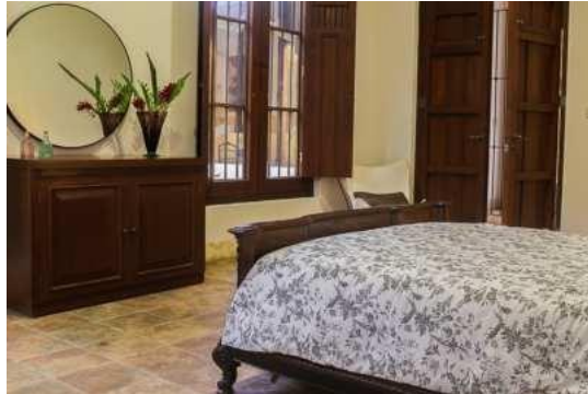
Catalina- 1 Queen size 1 Sofacama matrimonial