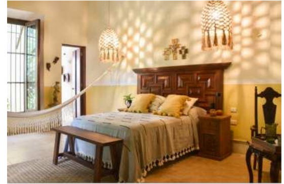
Rafaela - 1 Queen size