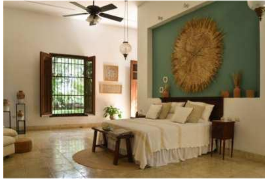
Mariaelena - 1 King size