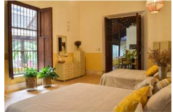
Elvia- 2 Queen size